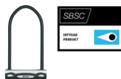
ABUS Varedo 47