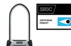
ABUS 540 Granit X-Plus