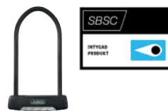
ABUS 470 Granit Plus