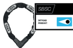
ABUS 1010 City Chain