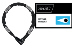
ABUS Kätting 9808