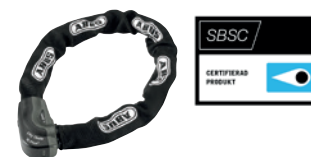
ABUS 1060 City Chain X-Plus