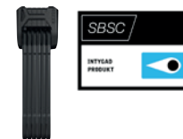
ABUS 6500 Bordo X-Plus