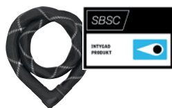
ABUS 8210 Iven