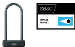
ABUS 640 Granit Plus 230 mm