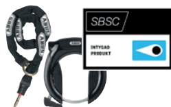
ABUS 5850/5950 Shield med kedja