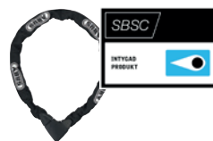
ABUS Kätting 8900