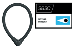
ABUS Steel-0-Flex 1000 Granit